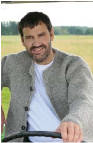
Weiss-blaue Seele grünes Gewissen

Am 28. September werden der Bayerische Landtag und die Bezirkstage neu gewählt. Erstmals seit Jahrzehnten ist eine Landtagswahl in Bayern wieder spannend. Bei den letzten Wahlen ging es ausschließlich darum, wie groß der Sieg der CSU ausfallen wird. Bei dieser Wahl ist es anders. Die CSU hat abgewirtschaftet, macht einen Schnitzer nach dem anderen und hat keine Antworten auf die drängenden Fragen der Zukunft. Gerade in den Stammregionen Ober- und Niederbayern zeigt sich das besonders deutlich. Nicht nur inhaltlich, sondern auch personell hat die CSU nichts mehr zu bieten. Immer mehr Wählerinnen und Wähler wenden sich enttäuscht ab.